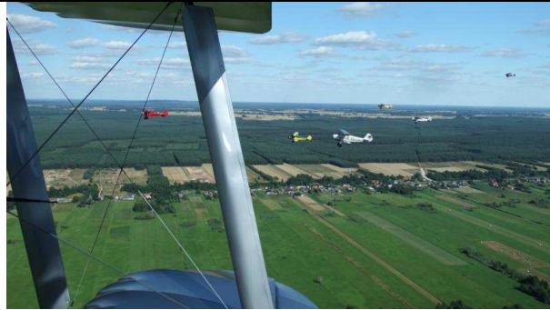
In Formation Richtung Osten

Auf Einladung der Stadtverwaltung von Schneidemühl in Pommern (heute Pila) zum 500 Stadtjubiläum im Gruppenflug.