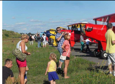
Die Bevölkerung war begeistert