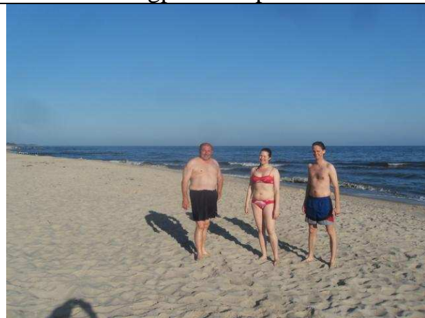
Frühschwimmen bei Kolberg in der Ostsee