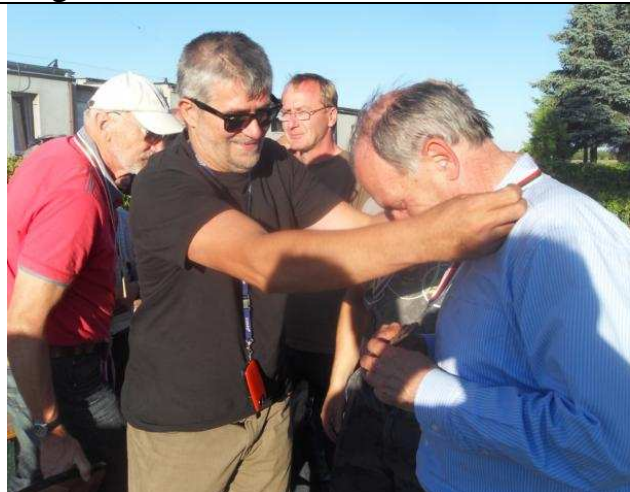
Mit Medaillen der Stadt werden die deutschen Piloten geehrt. Auf dem Flugplatz Pila wurde vor dem 1. Weltkrieg die Albatros Flugzeugwerke gegründet- darauf nimmt die überreichte Plakette Bezug.