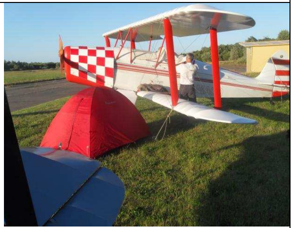
Übernachtung in Zelten auf ehemaligem russischen Militärplatz