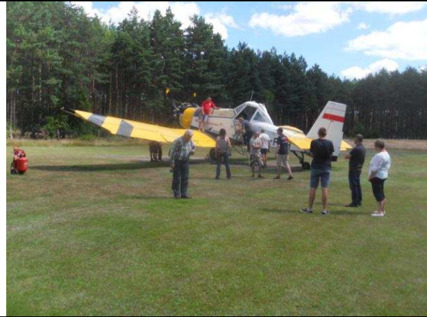
Zwischenstopp bei Freunden auf dem Feuerlöschflugplatz Krepesku