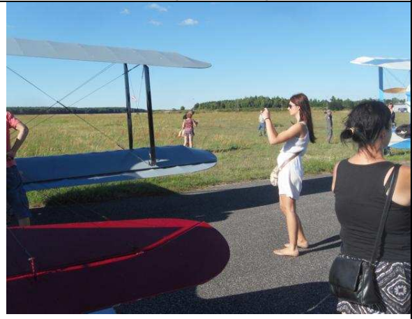
Der Bürstädter Kiebitz ein begehrtes Fotomotiv