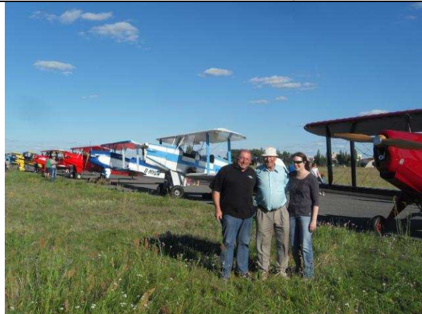
Begrüßung durch den Chef-Ausbilder der polnischen Atomstreitkräfte Likus Bogdan