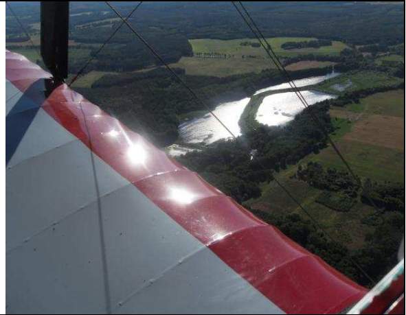
Weiterflug über die riesigen Wälder Pommerns an die Ostsee